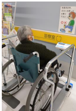
(バリアフリースケール)

診察に健康状態の評価に必要な体重測定。今まで足腰の不自由な方には大変ご不便をおかけしました。これからは車椅子に乗ったままでも測れる体重計を設置し、車椅子の重さを差し引いた体重を記録しますので、安心してご利用いただけるようになりました。