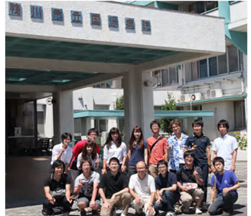
自治医科大学の後輩らと夏期実習の折に