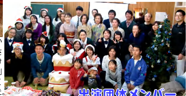
出演団体メンバー

あわただしい年の瀬にひと休み。楽しい音楽とお茶で暖かなひとときを。長狭高校合唱部、亀田医療大学吹奏楽部、茶香会、鴨川ウインドアンサンブルの出演を頂き、大変盛り上がりました。病院職員も恒例のハンドベルで参戦。